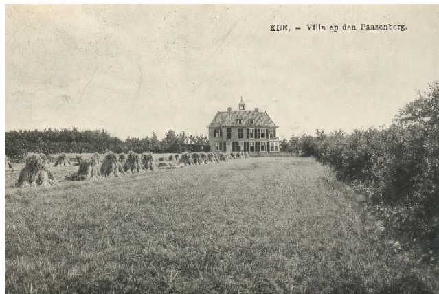
Ansichtkaart Ede - Villa op den Paaschberg