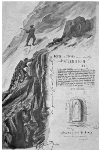
Illustratie uit dagboek Matterhorn

Van Eeghen schreef over deze onderneming een dagboek met illustraties, dat in 1952, veertien jaar na zijn overlijden, werd gepubliceerd. 13 Het duo kwam op 28 juni aan in Zermatt. Zij maakten eerst onder leiding van een lokale berggids twee oefentochten. 14 Daarna trokken zij, nu onder leiding van twee berggidsen, een week over de zogenaamde Haute Route Zermatt - Chamonix . Dat is een hoge alpiene route over gletsjers en hoge cols. Dit alles om goed geacclimatiseerd en geprepareerd te geraken. Uiteindelijk beklommen zij de Matterhorn vanuit Breuil-Cervinia in Italië op 7 en 8 juli 1881. Zowel voor Van Eeghen als voor Beels gingen per persoon twee berggidsen en een drager mee. De berggidsen waren onder andere Jean-Antoine Carrel en Jean Joseph Maquignaz, welke beiden in die tijd tot de absolute top behoorden. Leopold omschreef het dagboek van Van Eeghen over zijn Matterhorn beklimming: "geen bedachtzaamheid, geen diepe ernst, neen, een kleurrijk verhaal vol humor en zelfspot, een juweeltje in de Nederlandse alpiene literatuur". 15 Niet alleen een 'saai piet' dus deze Van Eeghen, maar tegelijk een enthousiaste avonturier.