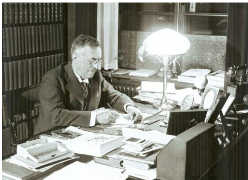
Hedin achter zijn bureau in Stockholm in 1935