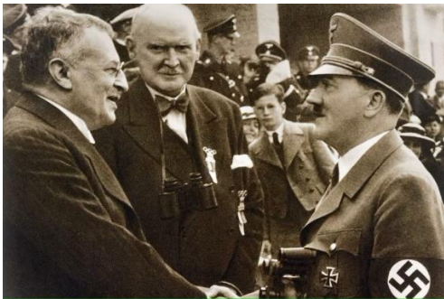
Hedin ontmoet Hitler tijdens de Olympische Spelen in 1936 in Berlijn

Wereldoorlog en het juk van Versailles. Hij sprak zich wel uit tegen de behandeling van de Joden en de houding van de nationaalsocialistische regering ten opzichte van de Lutherse kerk. Publicatie van een boek in 1937 over Duitsland van zijn hand werd verboden, vanwege kritische passages over de nationaalsocialisten. 17 Evenwel bleef hij loyaal aan Duitsland. 18 Hedin had persoonlijk toegang tot Hitler en tot zijn ministers. Voor de Zweedse regering was hij daarmee een unieke link met Duitse nationaalsocialistische leiders. 19 De dreiging uit Rusland, inmiddels als 'bolsjewistisch' gevaar, leek bij Hedin de sympathie voor Duitsland in stand te houden. Na de oorlog kon Hedin de volledige omvang van wat er in de concentratiekampen was gebeurd nauwelijks geloven. De Duitse volksaard kon toch onmogelijk dit soort misdaden tegen de menselijkheid hebben toegestaan, laat staan te hebben uitgevoerd. 20