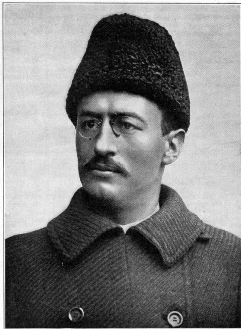
De jonge Sven Hedin in 1897

Hedin was in zijn tijd een internationaal beroemde ontdekkingsreiziger. Later was hij omstreden. Hij werd wereldberoemd vanwege zijn belangwekkende expedities in Centraal-Azië en Tibet, de publicaties daarover en zijn vele topografische en wetenschappelijke werk. Zijn reputatie werd omstreden vanwege zijn sympathie voor het Duitse leiderschap in de Eerste en Tweede Wereldoorlog. Wie was deze Hedin? En, wat was zijn connectie met Nederland?